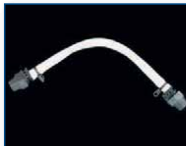
Reserve verdringings slang